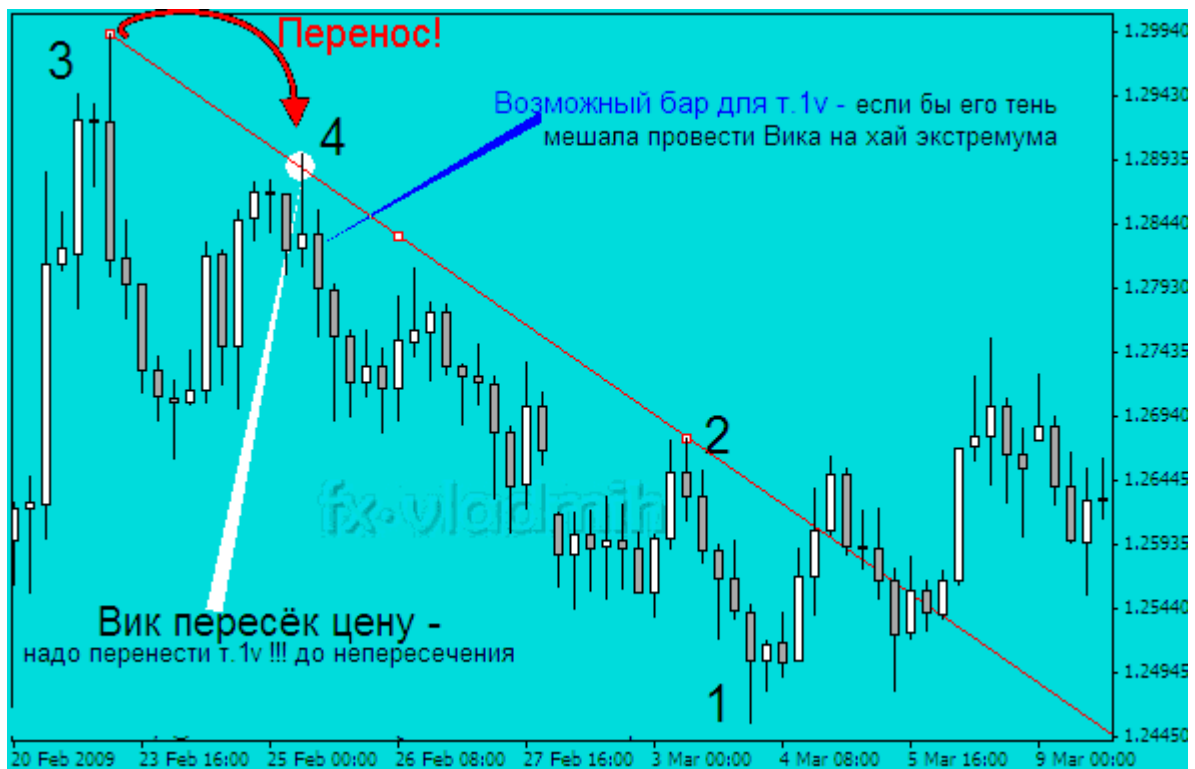
Построение Вика - определение опорных точек